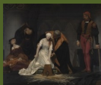
ホール・ドラローシュ 《レディ・ジェーン・グレイの処刑》 1833年、油彩、カンヴァス、ロンドン・ナショナル・ギャラリー蔵 ©The National Gallery, London. Bequeathed by the Second Lord Chelyesmore, 1902

「恐怖」に焦点をあて、その絵の時代背景や隠された物語という知識をもとに読み解くベストセラー『怖い絵』(中野京子著)の刊行10周年を記念した本展。さらに『怖い絵』の世界を感じて頂けるよう、作品の恐怖を読み解くためのヒントをもとに、みなさんに想像力を働かせてもらえる展示を予定しています。