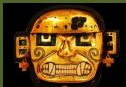
《黄金製の神像》 モチエ文化(紀元200年頃から750/800年頃) ペルー文化庁・国立博物館所蔵

いくつもの文化が連なり、影響を与え合う中で育まれた神々の神話や儀礼、神殿やピラミッドをつくり上げる優れた技術、厳しくも多彩な自然環境に適応した独自の生活様式などを、約200点の選び抜かれた貴重な資料によって明らかにします。