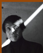
ポートレート

稀代の建築家・安藤忠雄が、いかに生きて、いかに創り、今またどこに向かおうとしているのか—その壮大な挑戦の軌跡と未来への展望を6つのセクションに分けて紹介します。