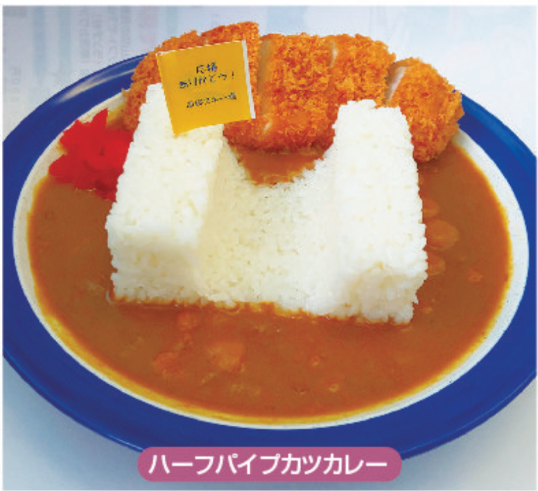
ハーフパイプカツカレー