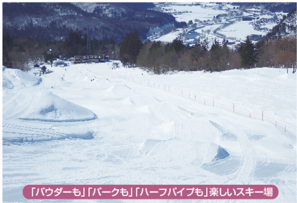
「パウダーも」「パークも」「ハーフパイプも」楽しいスキー場