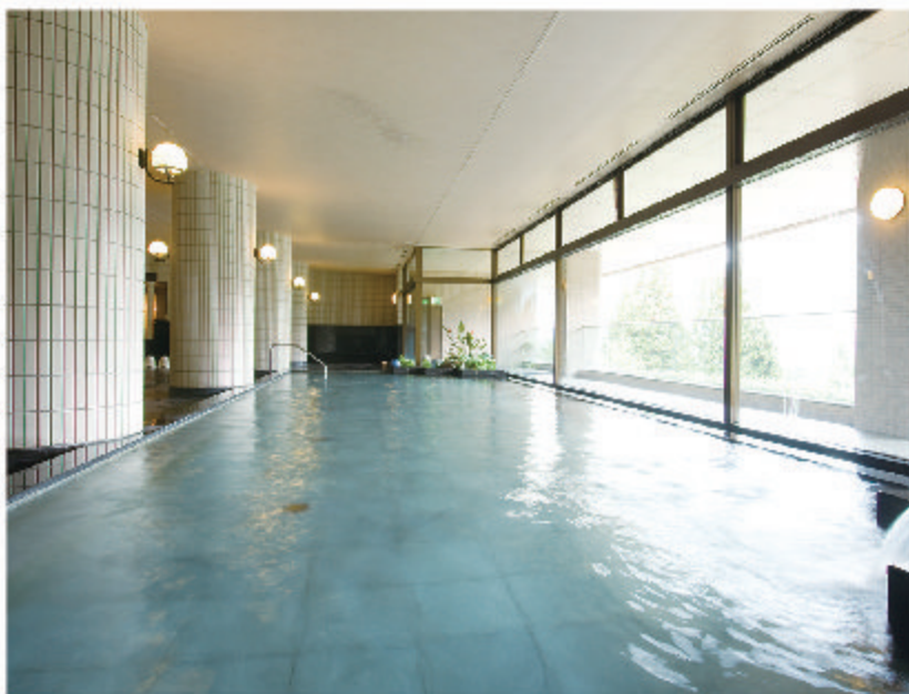
男女各250坪の大浴場は『美人の湯』