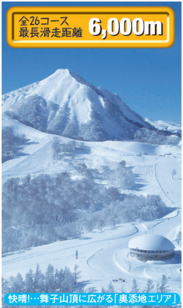
快晴!…舞子山頂に広がる「奥添地エリア」