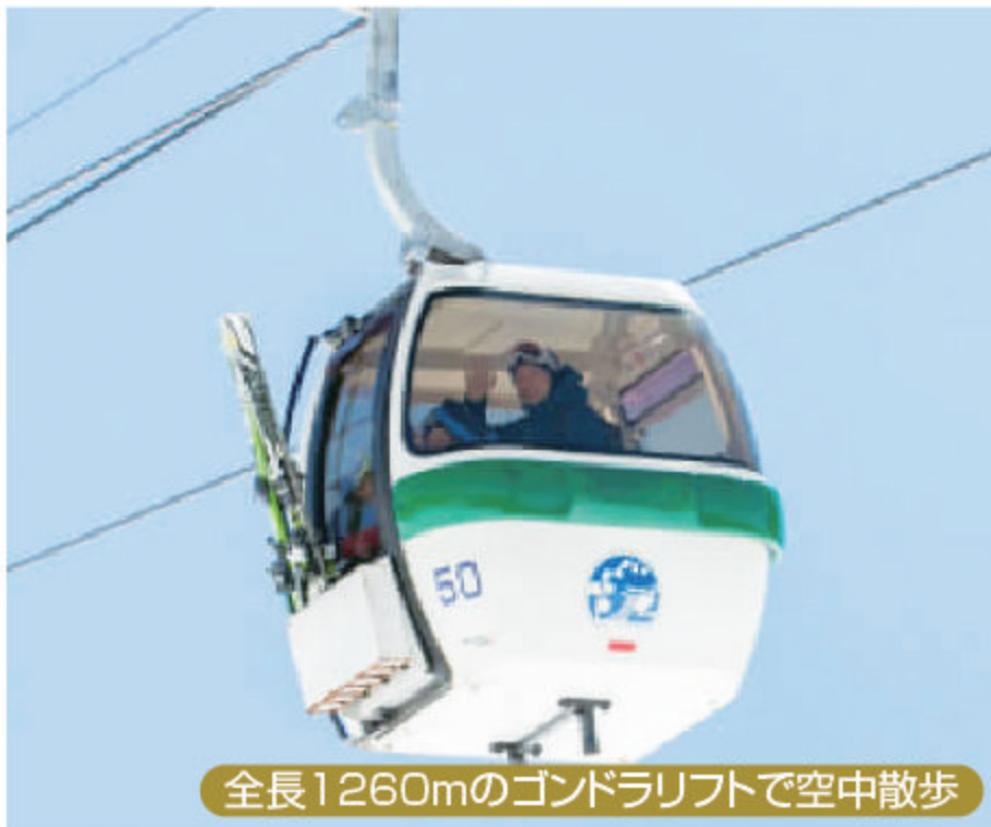
全長1260mのゴンドラリフトで空中散歩