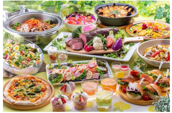
※ハイランドリゾートホテル&スパ「フジヤマテラス」フェアメニューイメージ

「フラワーフェスタ」の開催に合わせて、富士急ハイランド園内や隣接するオフィシャルホテル・ハイランドリゾートホテル&スパのレストランでも草花をテーマにしたフェアメニューをご提供いたします。また、ふじやま温泉、フジヤマミュージアムなどの周辺各施設、富士急行線や近隣エリアを走行する路線バスにおいても、花にちなんだイベントを同時開催するなど、エリアの至る所で花をお楽しみいただける盛りだくさんの内容となっております。