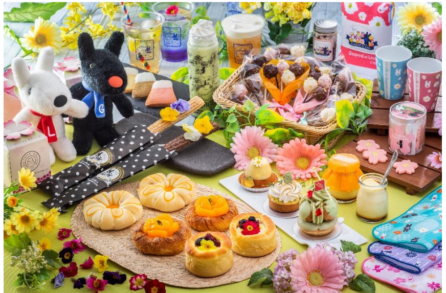
※フラワーメニューイメージ

★フェアメニューをご購入の方には当イベント限定のオリジナルステッカーをプレゼントいたします。