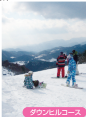
ダウンヒルコース